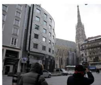
海外ロケ(ウィーン)