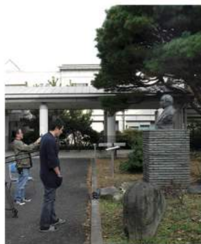
松沢病院の呉秀三胸像

呉秀三(くれしゅうぞう)は、今から百年前の時代に東京大学医学部精神科の教授として、異例の社会的な取り組みを進めた先達者である。彼は精神疾患の人々が「座敷牢」に押し込まれる実情を憂い、その解決のために奔走した。その土台となった報告書『精神病患者私宅監置ノ実況及び其統計的観察』を1918年に提起し、多方面へ働きかけた。それから1世紀の年月が過ぎた今、精神障害者の問題はどのようなになっているのだろうか？