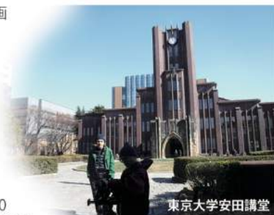
東京大学安田講堂

作品の中に登場する資料には、現存する2冊のみの「私宅監置」報告書(1冊は岡田先生の手元に、もう1冊は国会図書館!)、呉秀三の初めての著作の初版本、家族にあて欧州から送った絵葉書(既に所在不明!)、秘蔵されていた数枚の写真(東大医学図書館に保管)などがある。日本で初公開!呉秀三の欧州留学先での足跡——彼が1900年前後に留学・視察したベルギーとオーストリア(ウィーン大学)に残されている「自筆の署名」を求めて海外ロケを敢行し、彼の下宿アパートもカメラに収めてきた。